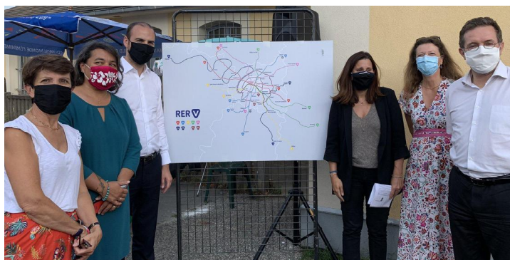
Parlons Vélo Massy 2020 | Les prémices du RER-Vélo (RER V) se dessinent 1 an après la création du Collectif vélo IDF

MDB (Mieux se Déplacer à Bicyclette) est une association active sur le territoire via ses multiples antennes dont sa branche locale de Massy. Elle milite pour sensibiliser le grand public à la pratique cyclable du quotidien via des remises en selle, vélos-école (enfants et adultes), savoir rouler à vélo dans les écoles, ateliers de co-réparation, marquage bicycode, balades à vélo, co-vélotage, et par le biais d'outils participatifs et cartographiques (OSM).